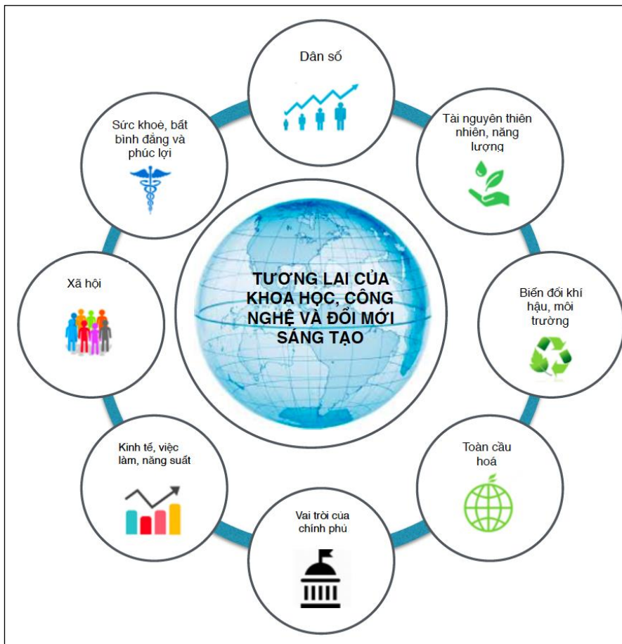
Hình 1.1. Tám xu hướng lớn ảnh hưởng đến STI

Những xu hướng lớn (Megatrends) là những thay đổi về mặt xã hội, kinh tế, chính trị, môi trường hoặc công nghệ quy mô lớn, diễn ra một cách chậm chạp tuy nhiên lại có ảnh hưởng sâu sắc và lâu dài đối với nhiều hoạt động, quá trình và nhận thức của con người. Những xu hướng lớn này được chia thành 8 lĩnh vực chuyên đề như sau: Dân số; tài nguyên thiên nhiên và năng lượng; biến đổi khí hậu và môi trường; toàn cầu hoá; vai trò của chính phủ; kinh tế, việc làm và năng suất; xã hội; sức khoẻ, bất bình đẳng và phúc lợi (Hình 1.1).