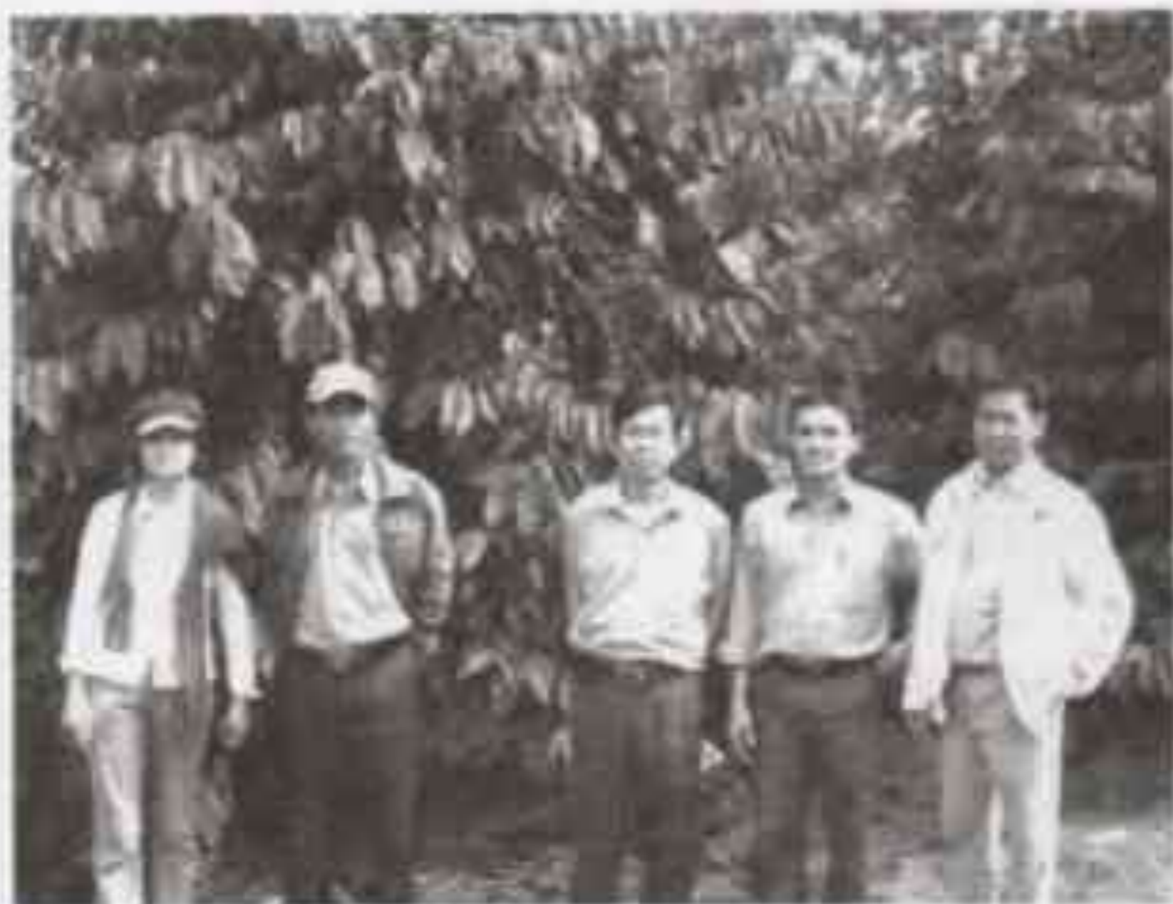
Mô hình thâm canh cây chè và cà phê tại xã Lộc Lâm

Ứng dụng năng lượng mặt trời để đun nước nóng cho các nhà trẻ, trạm y tế vùng đồng bào dân tộc; Ứng dụng các biện pháp tiết kiệm năng lượng trong sản xuất hoa cúc tại Đà Lạt; Ứng dụng các quy trình kỹ thuật nuôi cấy, nhân uơm cây giống, trồng và chăm sóc cây chuối La Ba cho nông dân các địa phương trong tỉnh.