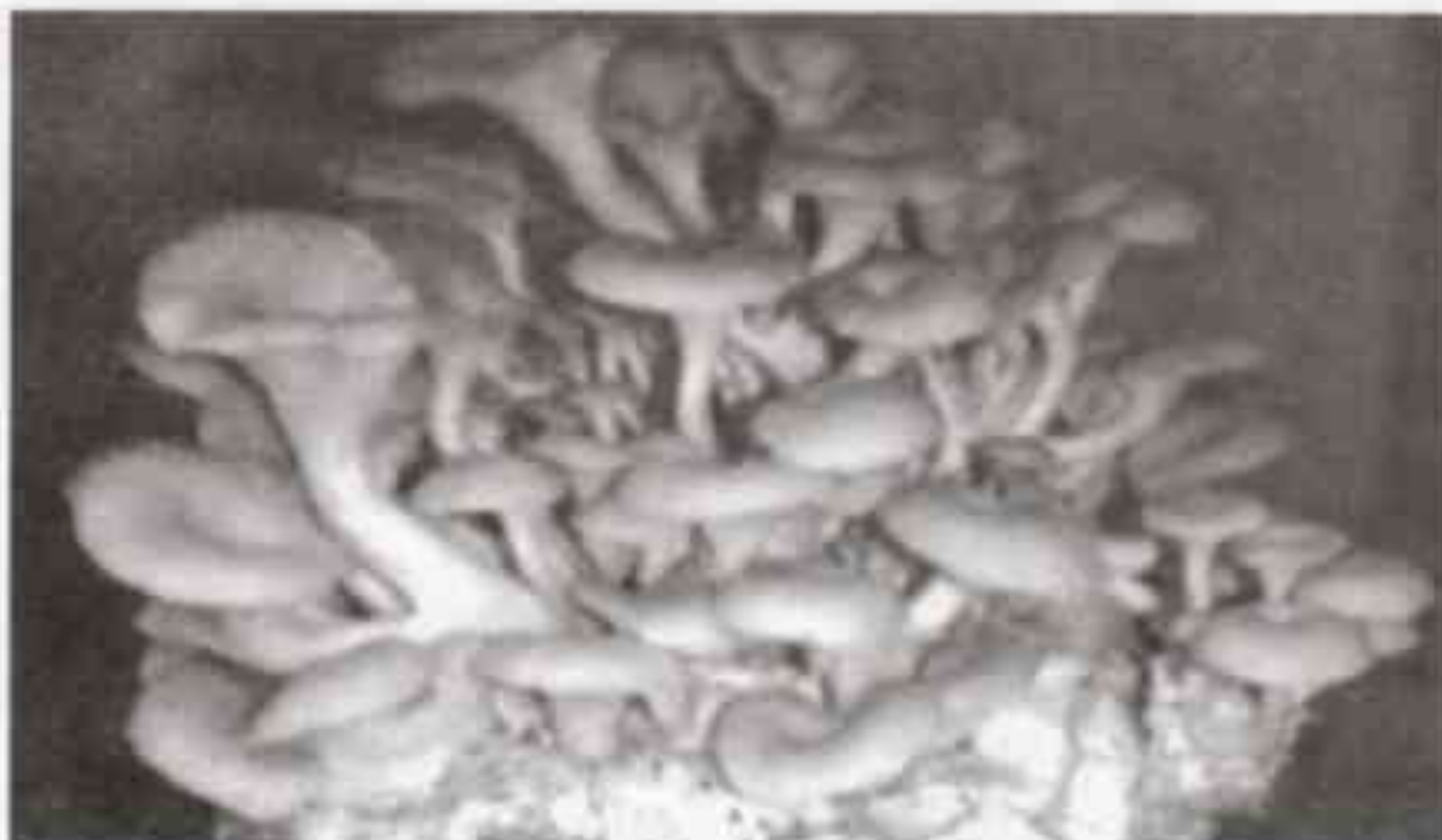
Nấm Bào ngư Kim đình