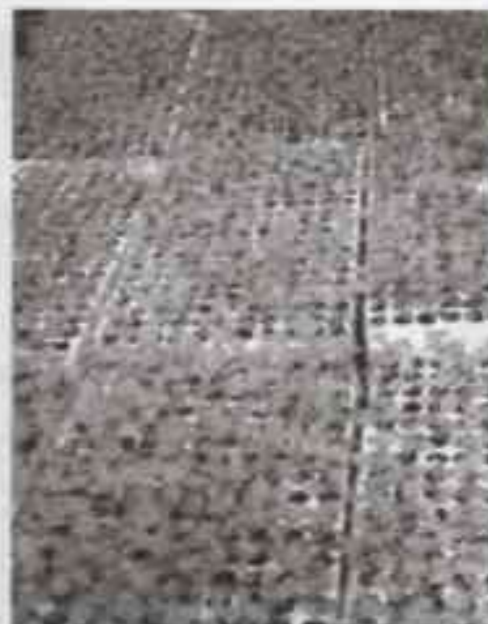
Nuôi cấy mô tế bào, nhân ươm cây giống sạch bệnh

Phân lập, sản xuất các giống nấm dược liệu, nấm ăn, men vi sinh, chế phẩm sinh học. Chuyển giao kỹ thuật sản xuất giống, kỹ thuật