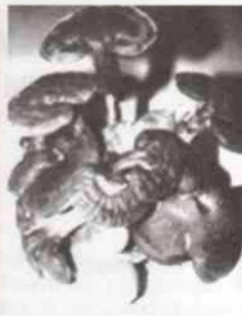
Nấm Linh chi đỏ Đà Lạt

2. Triển khai dự án “Xây dựng mô hình ứng dụng tiến bộ khoa học công nghệ trong sản xuất hoa theo hướng công nghiệp tại Đà Lạt” với quy trình kỹ thuật tiên tiến. Qua 2 năm triển khai mô hình, lợi nhuận của người nông dân đã tăng đáng kể, sản lượng hoa tăng với chất lượng ổn định hơn mà vẫn tiết kiệm được chi phí sản xuất. Nhận thấy lợi ích từ dự án mang lại, nhiều nông dân tham gia mô hình đã mở rộng diện tích sản xuất theo quy trình kỹ thuật này và mang lại hiệu quả kinh tế ngày một cao hơn.