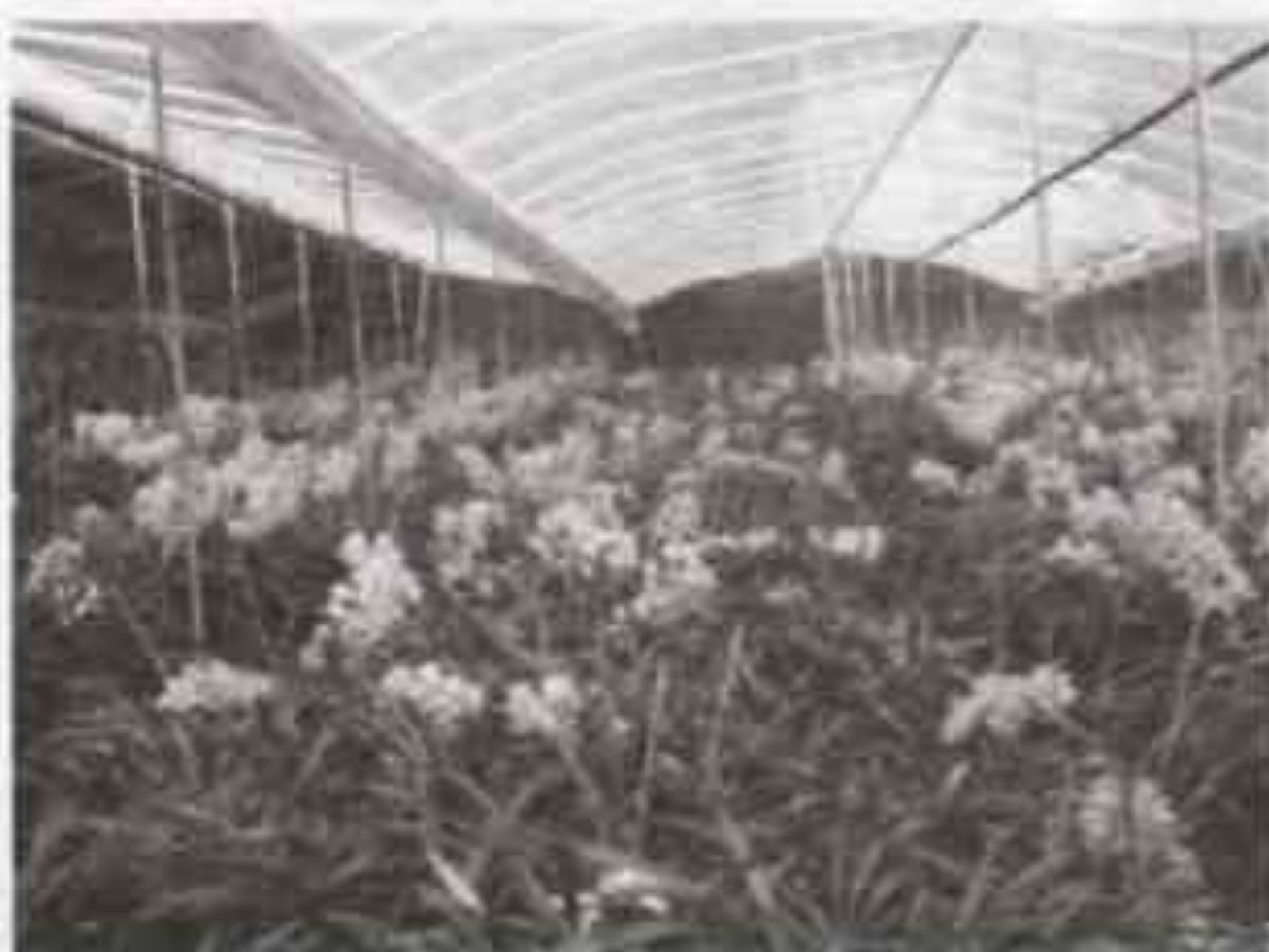
Mô hình sản xuất hoa địa lan – hoa hồng thương phẩm

Thông qua dự án, một số quy trình kỹ thuật sản xuất hoa thương phẩm đã được xây dựng và chuyển giao nhân rộng đến các vùng sản xuất hoa của tỉnh như Đà Lạt, Đức Trọng, Lạc Dương, Đơn Dương và một số tỉnh, thành khác.