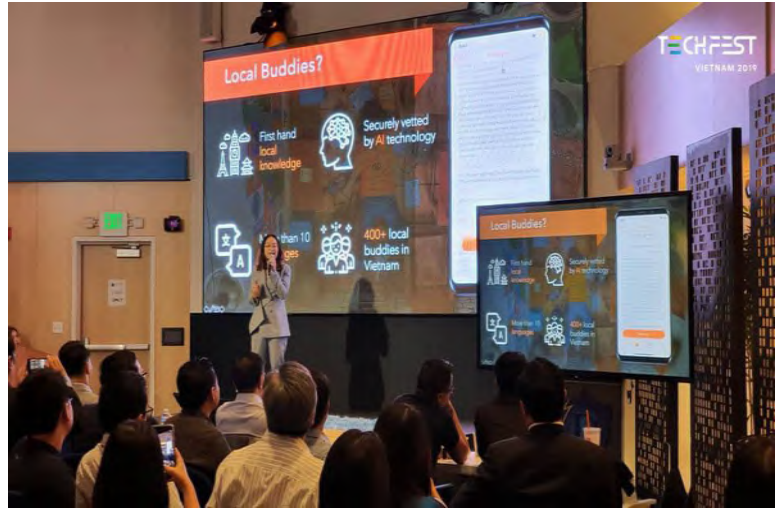
Đại diện Tubudd (ứng dụng du lịch bản địa) thuyết trình với nhiều quỹ đầu tư tại Mỹ vào tháng 9/2019

Điều này cho phép các chương trình kết nối đầu tư (business matching) có thể thuê những chuyên gia có mạng lưới quan hệ rộng để huy động nhiều quỹ đầu tư lớn tham gia. Các đòn bẩy trên sẽ giúp đưa yếu tố quốc tế về Việt Nam và góp phần đưa startup Việt Nam cạnh tranh trên thế giới. Các nhà hoạch định chính sách kỳ vọng “thầy giỏi sẽ tạo nên trò tốt”, khi chất lượng các chuyên gia, khóa đào tạo, hội nghị, hội thảo, buổi kết nối được nâng lên sẽ có càng nhiều startup tiềm năng xuất hiện.