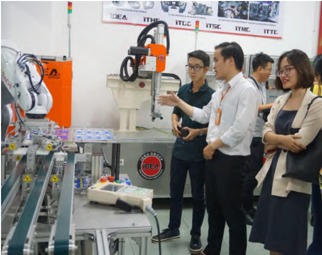
Dây chuyền sắp xếp hàng hóa tại Khu công nghệ phần mềm Đại học quốc gia thành phố Hồ Chí Minh