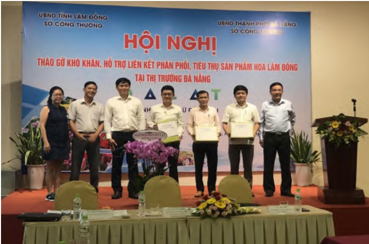
Hội nghị thảo gỡ khó khăn, hỗ trợ liên kết phân phối, tiêu thụ sản phẩm hoa Lâm Đồng tại thị trường Đà Nẵng

của các tiểu thương, đại lý, đại diện các đơn vị vận chuyển và cơ quan quản lý nhà nước liên quan đến ngành hoa của tỉnh Lâm Đồng và thành phố Đà Nẵng. Tại Hội nghị, các đơn vị tham gia trao đổi các khó khăn, vướng mắc gặp phải như: