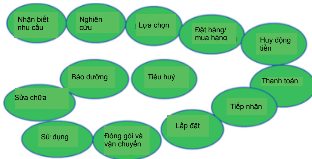
Hình 1. Chuỗi tiêu thụ

được xác định bằng cách sử dụng một số kỹ thuật. Một cách hữu ích để xem xét những vấn đề mà khách hàng đang gặp là thông qua một mô hình được gọi là chuỗi tiêu thụ. Chuỗi tiêu thụ bao gồm một loạt các bước điển hình mà khách hàng phải trải qua để có được và sử dụng hàng hóa và dịch vụ. Bất kỳ bước nào trong chuỗi tiêu thụ đều có thể có một vấn đề mà khách hàng đang không hài lòng và là cơ hội cho một giải pháp mới. Chuỗi tiêu thụ được minh họa trong Hình 1.