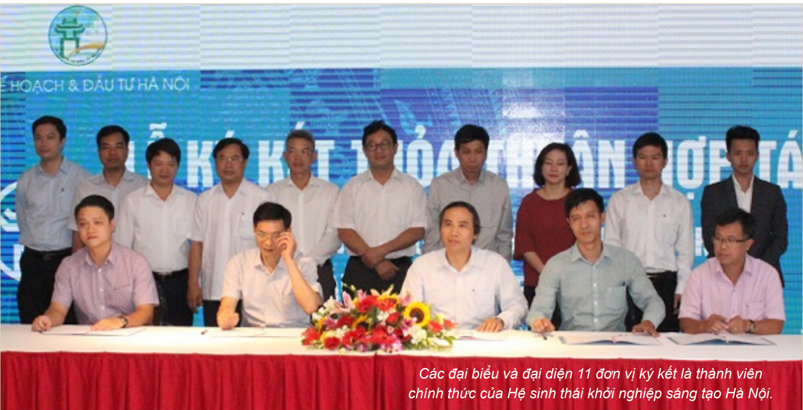
Các đại biểu và đại diện 11 đơn vị ký kết là thành viên chính thức của Hệ sinh thái khởi nghiệp sáng tạo Hà Nội.