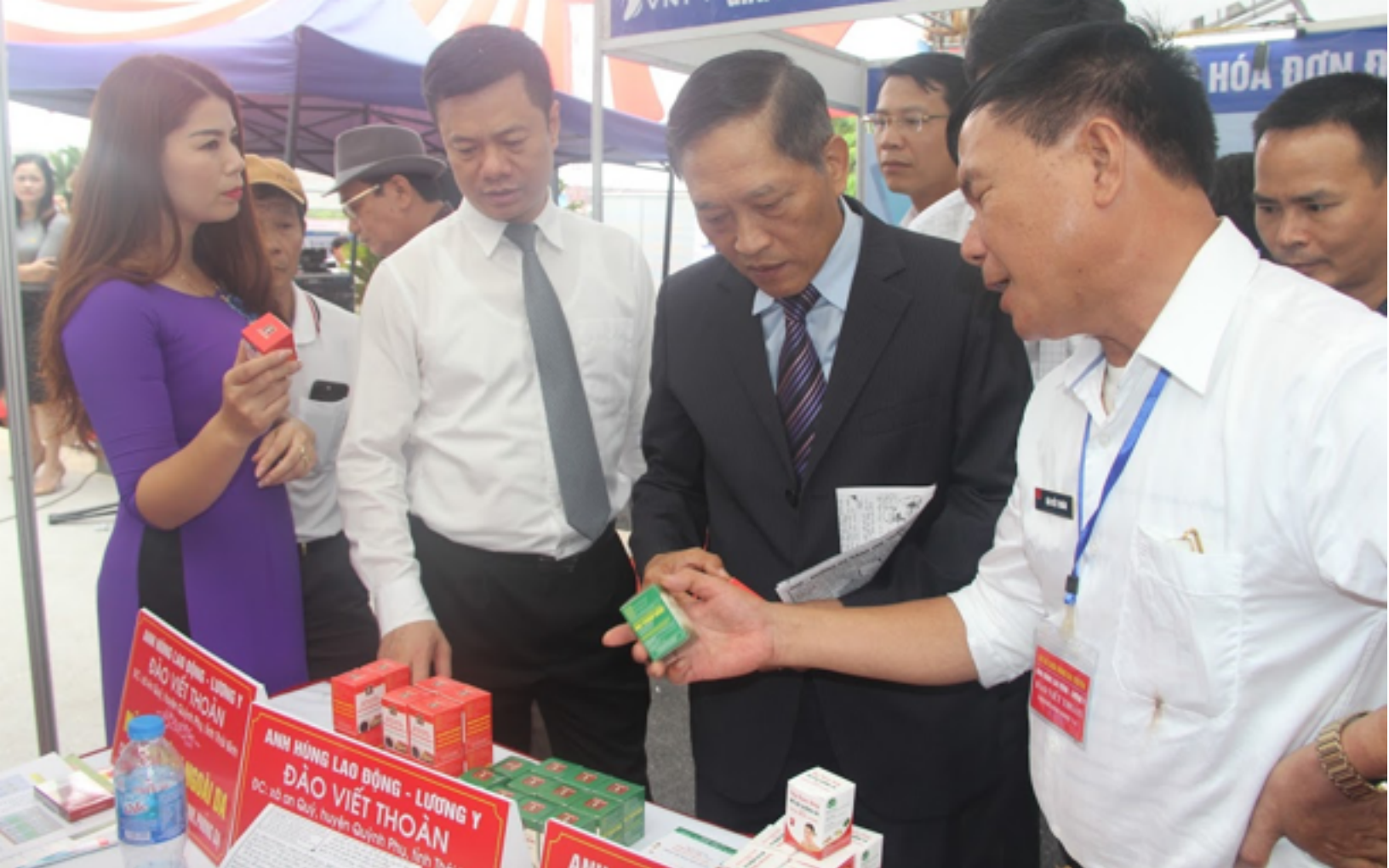
Các đại biểu đi tham quan các gian hàng tại Triển lãm

của cộng đồng. Diễn ra song song cùng Triển lãm là Ngày hội khởi nghiệp Hải Phòng lần thứ II (Techfest Haiphong 2018) với chủ đề “Nghiên cứu khoa học đồng hành cùng khởi nghiệp sáng tạo” nhằm trưng bày, giới thiệu các ý tưởng, sản phẩm dự án khởi nghiệp thu hút sự quan tâm của các cá nhân, cộng đồng doanh nghiệp khởi nghiệp.