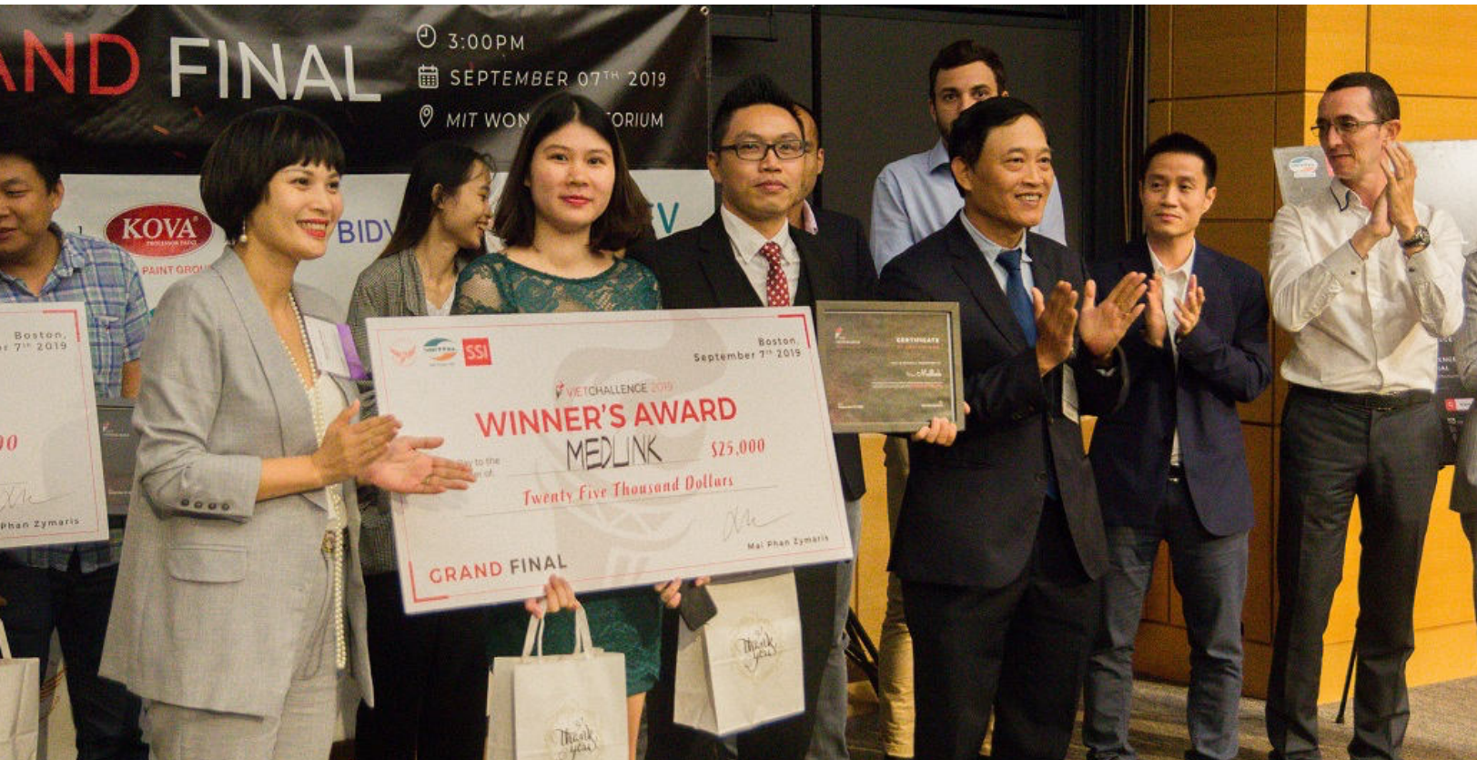
Thứ trưởng Trần Văn Tùng trao giải cho Medlink - startup vượt qua 400 dự án của người Việt trên toàn thế giới để vô địch Vietchallenge 2019.