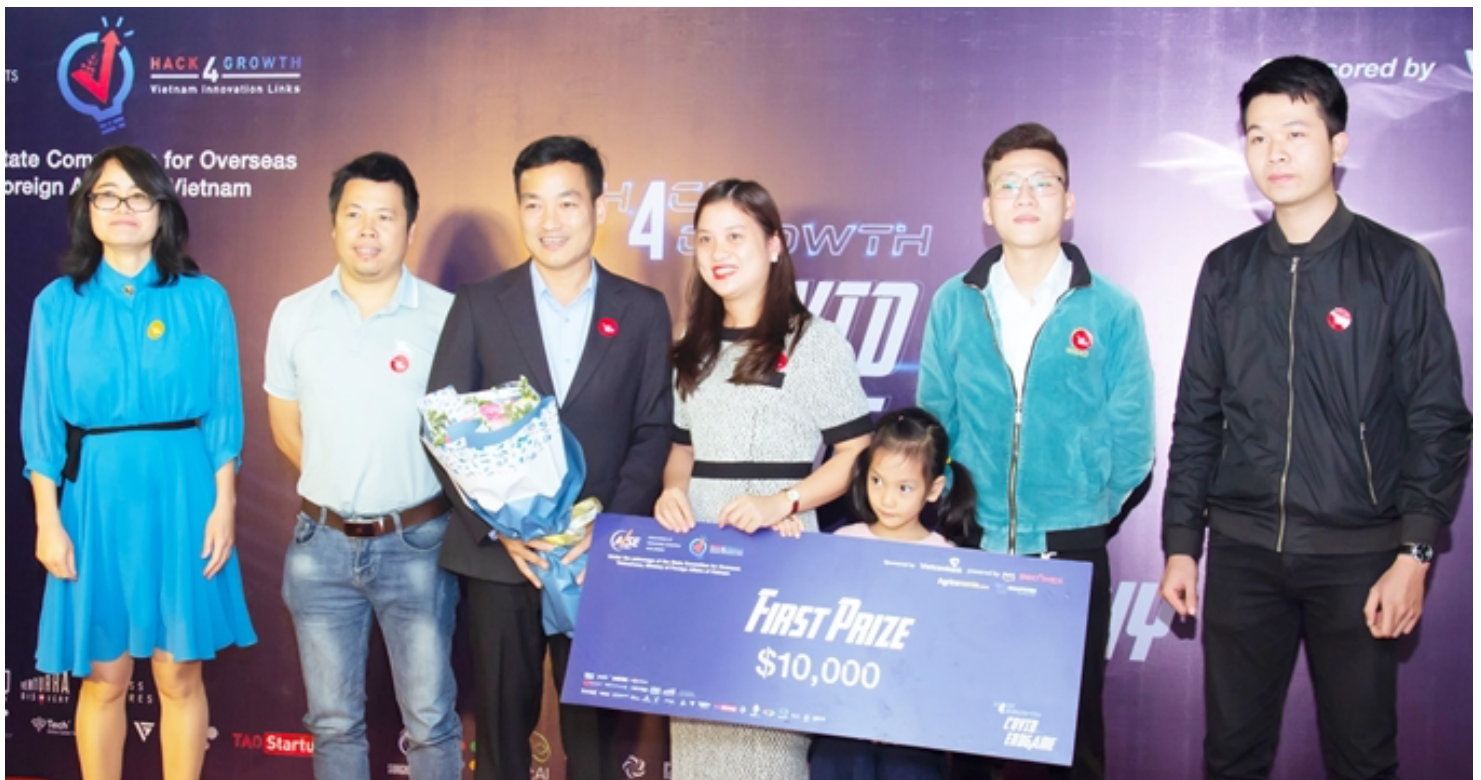
Giải nhất cuộc thi Hack4Growth mùa 1 trị giá $10.000 thuộc về dự án Egreen - Phát triển điện Biogas, giảm phát thải & ứng phó với biến đổi khí hậu.

Bên cạnh đó, ngoài triển khai cuộc thi tại Việt Nam, Hack4Growth mùa hai sẽ được phát động trên 4 khu vực lớn, bao gồm: Khu vực châu Âu: đồng hành cùng Mạng lưới khởi nghiệp Vietnam Startup Network Europe (VNSE); Khu vực Úc: đồng hành cùng Mạng lưới đổi mới sáng tạo Việt Nam - Australia (NIC - AU) và Mạng lưới thúc đẩy khởi nghiệp Việt Nam tại Úc - Startup Vietnam Frontier (SVF - AU); Khu vực Bắc Mỹ: đồng hành cùng Hội Doanh Nhân Người Việt tại Mỹ (The Vietnamese Entrepreneurs Network in the United State of America - VENUSA); Khu vực Nhật Bản: đồng hành cùng Mạng lưới đổi mới sáng tạo Việt - Nhật (VJOIN)