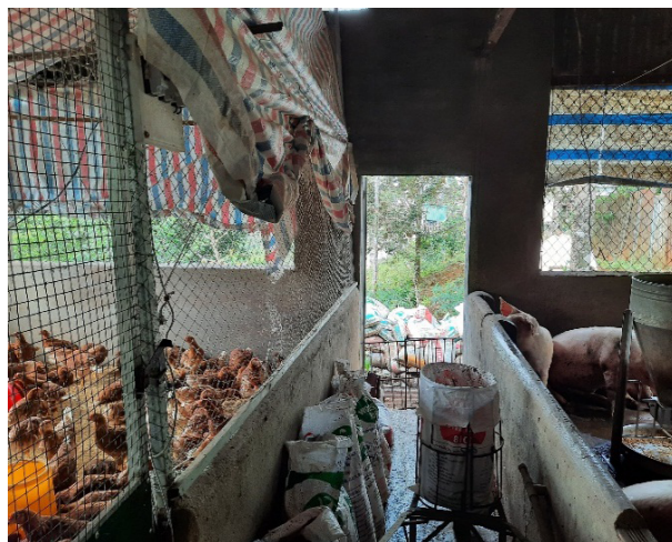
Hướng dẫn thu gom chất thải tại cơ sở chăn nuôi