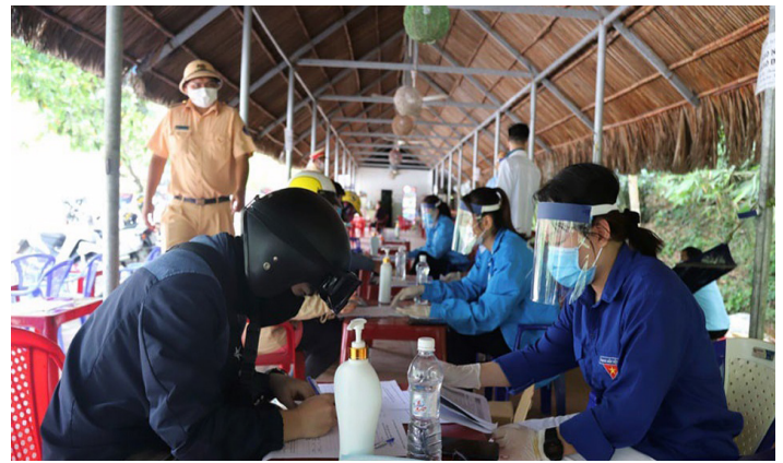
Thanh niên tình nguyện hướng dẫn người dân vào địa phận Lâm Đồng khai báo y tế phòng dịch Covid-19

Thứ nhất , có sự tập trung lãnh, chỉ đạo đúng đắn, quyết liệt, kịp thời của Tỉnh ủy, UBND tỉnh, Ban Chỉ đạo phòng, chống dịch Covid-19 tỉnh Lâm Đồng; sự vào cuộc của cả hệ thống chính trị, trong đó nổi bật là tinh thần trách nhiệm, tận tụy, vượt khó của các cán bộ ngành y tế, lực lượng quân đội, công an; sự cố gắng, chủ động, quyết liệt của cấp ủy, chính quyền các địa phương (đặc biệt là ở cơ sở xã, thôn, bản, ấp, khu phố, tại các khu cách ly...).