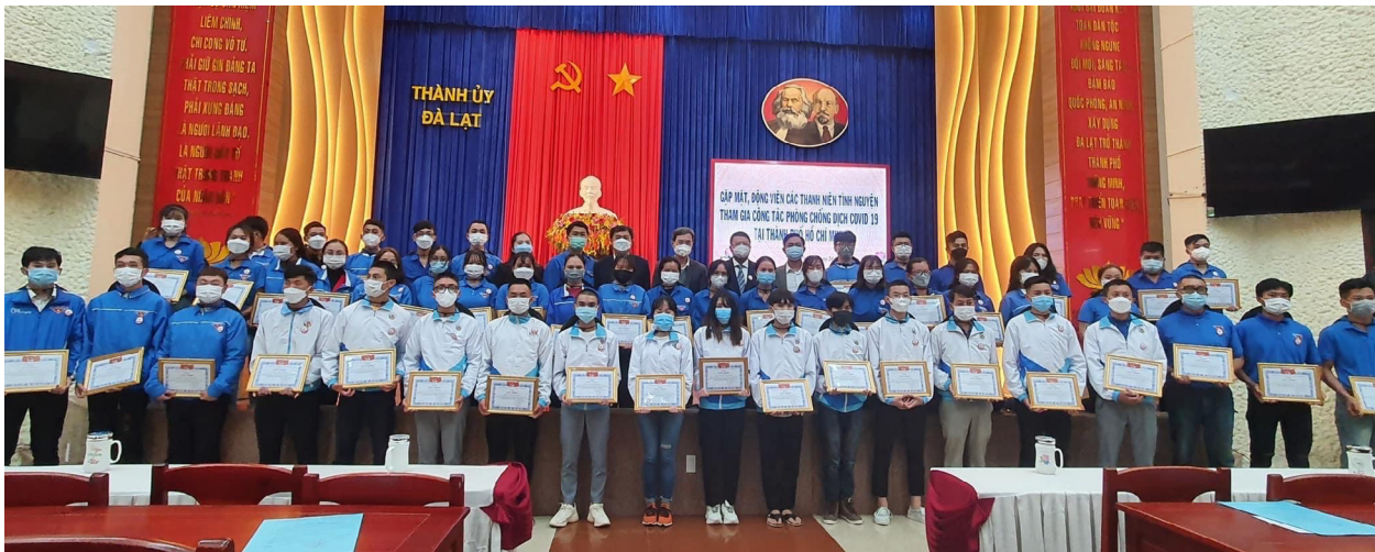
Lễ xuất quân đội hình thanh niên tình nguyện hỗ trợ Thành phố Hồ Chí Minh

Công tác tuyên truyền đã góp phần không nhỏ vào việc tăng cường sự đồng thuận xã hội, tin tưởng, đồng lòng thực hiện chủ trương, quan điểm, đường lối của Đảng và chính sách, pháp luật của Nhà nước, giải pháp chỉ đạo của cấp ủy, chính quyền trong tình hình về công tác phòng, chống dịch Covid-19.