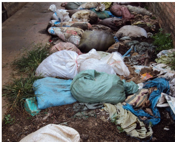
Thực trạng thu gom chất thải tại cơ sở chăn nuôi

Trên cơ sở số liệu điều tra, khảo sát thực tế tình hình chăn nuôi, quy mô của từng hộ, dự án tiến hành thiết kế, xây dựng các mô hình theo từng quy mô và hiện trạng cơ sở hạ tầng của hộ chăn nuôi hiện có nhằm tận dụng các cơ sở sẵn có, hạn chế những phát sinh về xây dựng có thể làm tăng chi phí sản xuất.