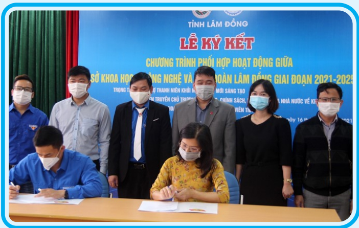
Lễ ký kết Chương trình phối hợp hoạt động giữa Sở Khoa học và Công nghệ và Tỉnh đoàn Lâm Đồng giai đoạn 2021-2025