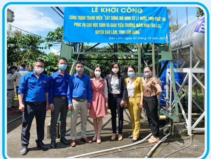
Chi đoàn Sở Khoa học và công nghệ triển khai công trình thanh niên tại huyện Bảo Lâm