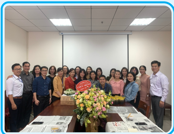
Sinh hoạt Ngày Phụ nữ Việt Nam 20/10