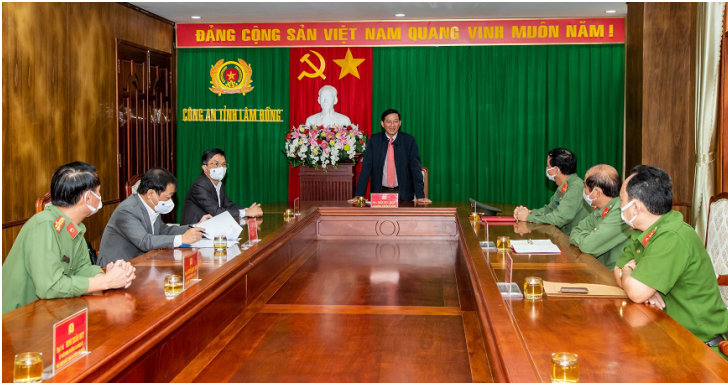
Đồng chí Trần Đức Quận - Bí thư Tỉnh ủy phát biểu tại buổi kiểm tra công tác phòng, chống dịch bệnh Covid-19 tại Công an tỉnh Lâm Đồng

Với tinh thần tình nguyện vì cộng đồng, trách nhiệm của lực lượng tuyến đầu và nghĩa cử cao đẹp của những cán bộ y tế, ngay sau khi Sở Y tế phát động, đã có hàng trăm bác sĩ, điều dưỡng, y sĩ từ các đơn vị y tế trực thuộc ngành y tế và một số trường đại học, cao đẳng trên địa bàn tỉnh đã đăng ký tình nguyện tham gia công tác phòng, chống dịch tại Thành phố Hồ Chí Minh, Bình Dương; với tinh thần đoàn kết, quyết tâm đẩy lùi dịch bệnh Covid-19, cùng với trình độ chuyên môn vững vàng, Đoàn công tác của tỉnh quyết tâm hoàn thành tốt nhiệm vụ được giao, chung sức, giúp đỡ Nhân dân tại Thành phố Hồ Chí Minh, Bình Dương vượt qua khó khăn, chiến thắng dịch bệnh.