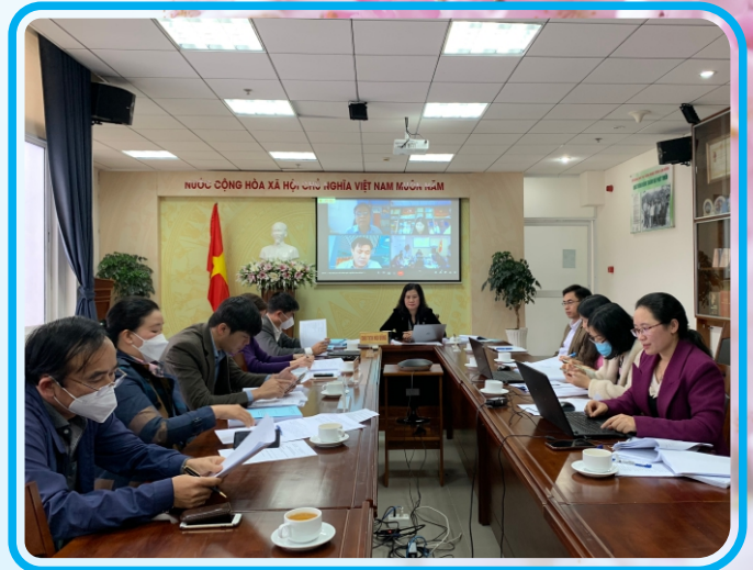
Nghiệm thu đề tài Đánh giá chương trình phát triển nông nghiệp ứng dụng công nghệ cao trên địa bàn tỉnh Lâm Đồng giai đoạn 2004-2018