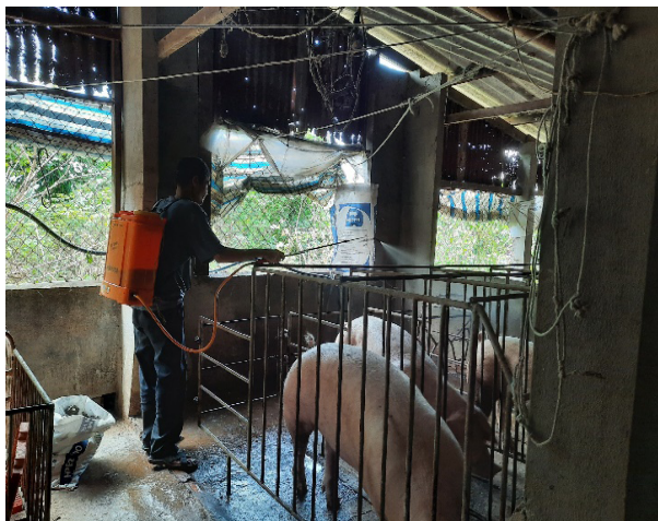
Phun xịt khử mùi khu vực bên trong chuồng trại

Cứ 15 ngày, tiến hành kiểm tra và đảo trộn đồng ủ. Sau ủ 60 ngày, kiểm tra thấy hỗn hợp