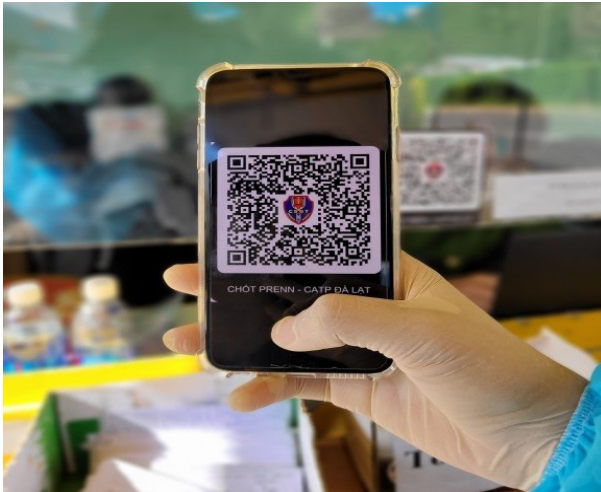
Ứng dụng Khai báo y tế bằng mã QR Code

công dân có thể sử dụng máy tính, điện thoại thông minh để thực hiện đăng ký khai báo y tế trước khi đi qua chốt kiểm soát dịch bệnh tại địa chỉ https://suckhoe.dancuquocgia.gov.vn . Về quy trình khai báo y tế thực hiện tương tự như khai báo qua các ứng dụng của Bộ Y tế; tuy nhiên, bổ sung thêm thông tin thường trú, lưu trú, tạm trú. Sau khi nhập đủ thông tin, hệ thống sẽ cấp mã QR code, người dân có thể chụp lại màn hình hoặc chọn mục lưu để lưu mã QR code sử dụng khi qua chốt kiểm dịch. Trường hợp công dân không có điện thoại thông minh để khai báo, cán bộ tại chốt kiểm soát sẽ phát phiếu khai báo y tế (mẫu thông tin khai báo y tế do Bộ Công an xây dựng) cho người dân để kê khai. Cán bộ công an làm nhiệm vụ tại các chốt kiểm dịch (qua máy tính hoặc điện thoại thông minh có kết nối internet) kiểm tra thông tin công dân khai báo bằng QR code tại địa chỉ https://kiemdich.dancuquocgia.gov.vn , mã QR được tạo sau khi công dân đã khai báo y tế xong.