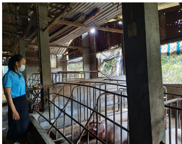
Thực hiện đo khí tại hộ chăn nuôi

có màu nâu đen, không có mùi hôi thì có thể sử dụng để bón cho cây trồng.