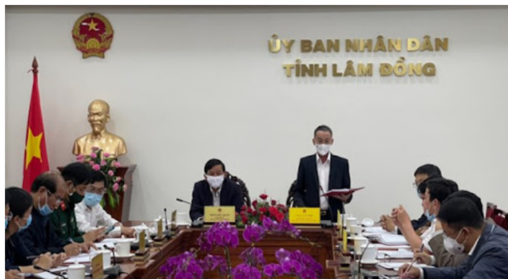
Ban Chỉ đạo phòng chống dịch Covid-19 tỉnh Lâm Đồng họp khẩn

Hưởng ứng lời kêu gọi của Tổng Bí thư Nguyễn Phú Trọng, Chủ tịch nước Nguyễn Xuân Phúc; thực hiện chỉ đạo của Tỉnh ủy, HĐND, UBND tỉnh Lâm Đồng, hưởng ứng Lời kêu gọi ngày 27/5/2021 của Đoàn Chủ tịch Ủy ban Trung ương Mặt trận Tổ quốc Việt Nam, Ủy ban Mặt trận Tổ quốc Việt Nam tỉnh Lâm Đồng đã ra Lời kêu gọi “ Toàn dân đoàn kết, ra sức phòng, chống dịch bệnh Covid-19 trên địa bàn tỉnh Lâm Đồng ”; Lời kêu gọi ngày 17/7/2021 về đợt thi đua cao điểm “ Toàn dân đoàn kết, quyết tâm phòng, chống dịch bệnh Covid-19 trên địa bàn tỉnh Lâm Đồng ”; Lời kêu gọi ngày 09/8/2021 “ Toàn dân đoàn kết, xây dựng khu dân cư an toàn trong