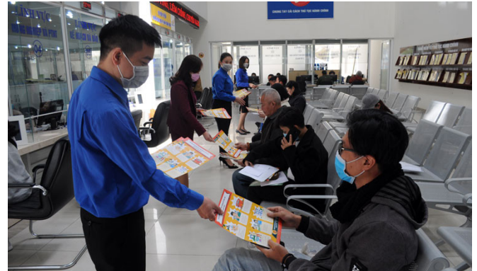
Phát tờ rơi tuyên truyền phòng, chống Covid-19 cho người dân

- Tiếp tục quán triệt, thực hiện nghiêm túc, đầy đủ, quyết liệt, hiệu quả các nội dung chỉ đạo của Ban Bí thư Trung ương Đảng, Chính phủ, Thủ tướng Chính phủ, Ban Chỉ đạo quốc gia phòng, chống dịch Covid-19, Bộ Y tế, Tỉnh ủy, UBND tỉnh Lâm Đồng; lấy người dân là trung tâm, chủ thể trong phòng, chống dịch và phục hồi sản xuất - kinh doanh; thực hiện tốt an sinh xã hội và đảm bảo quốc phòng, an ninh, trật tự an toàn xã hội, an ninh nông thôn để đảm bảo “mục tiêu kép” vừa phòng, chống dịch Covid-19 vừa phát triển kinh tế - xã hội trên địa bàn tỉnh.