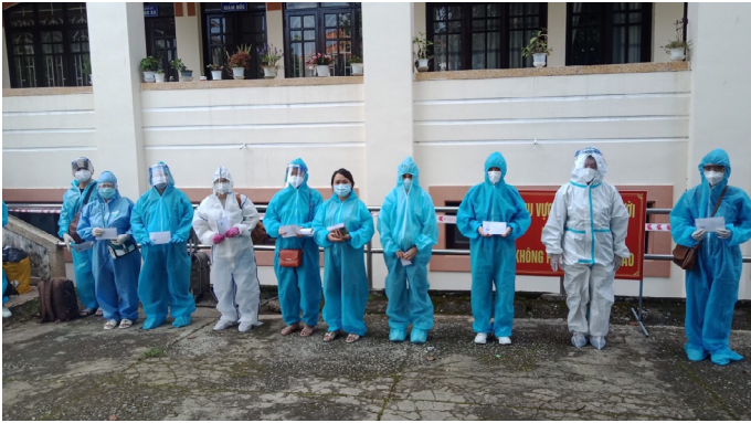
Thành phố Đà Lạt hỗ trợ đón thai phụ trở về từ vùng dịch

dung điều trị F0, hướng dẫn tư vấn sức khỏe cho người dân, tư vấn đặt lịch hẹn khám tại các cơ sở khám, chữa bệnh, hạn chế tập trung đông người và giảm nguy cơ lây lan dịch bệnh trong cơ sở khám, chữa bệnh và cộng đồng.