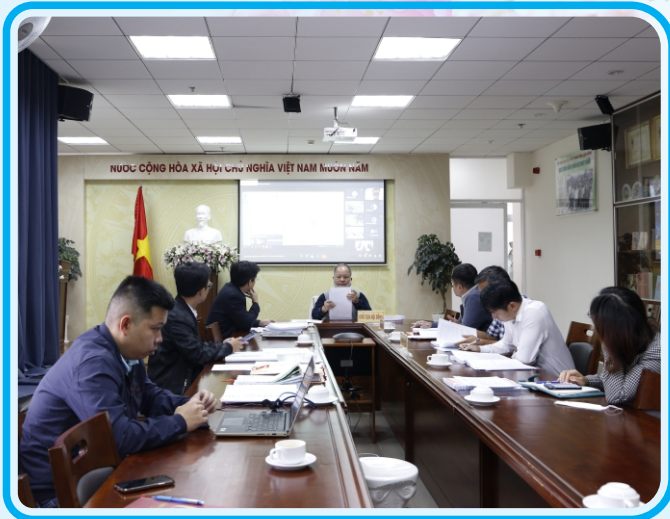
Nghiệm thu đề tài Nghiên cứu tính toán cân bằng nước và đề xuất giải pháp sử dụng hợp lý nguồn nước